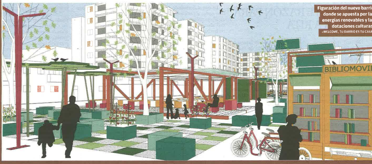
Figuración del nuevo barrio donde se apuesta por las energías renovables y las dotaciones culturales. «WELCOME, TU BARRIO ES TU CASA»

rrio es como una casa donde los productos frescos para la cocina se obtendrán de los huertos urbanos y la agricultura ecológica y donde se crearán espacios de ocio y descanso para fomentar la socialización del barrio. Una guardería, un mercado de kilómetro cero, viviendas baratas, rehabilitación de las alquerías y una apuesta clara por la sostenibilidad energética con sistemas de aprovechamiento solar y eólico en las azoteas de las casas son algunas de las propuestas que han visto la luz en las reuniones que se llevaron a cabo para el concurso de ideas. Los arquitectos, en todo el proceso, hacen las veces de facilitador atendiendo las propuestas y aportando su experiencia y conocimiento.